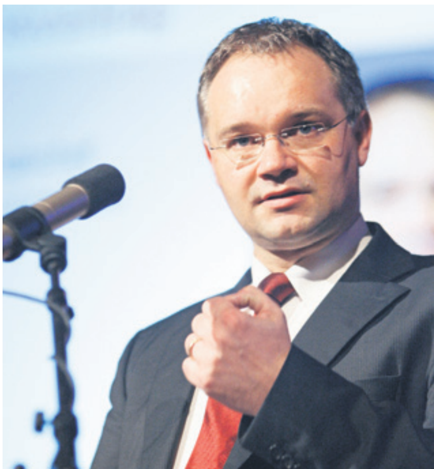
Der künftige Regierungschef Klaus Tschütscher: «In diesem neuen Koalitionsverständnis zeigen sich Grösse und Weitblick der VU als staatstragende Volkspartei.»

Diese Vision von einem engeren Zusammenwirken solle mit der Amtseinstellung der neuen Regierung nun Wirklichkeit werden. Die notwendigen politischen Entscheidungen müssten rechtzeitig getroffen werden, damit Liechtenstein als Lebensraum und Wirtschaftsstandort weiterhin attraktiv bleibe. «Natürlich sollen sich die Parteien auch künftig im Wettstreit um die besten Ideen profilieren können,