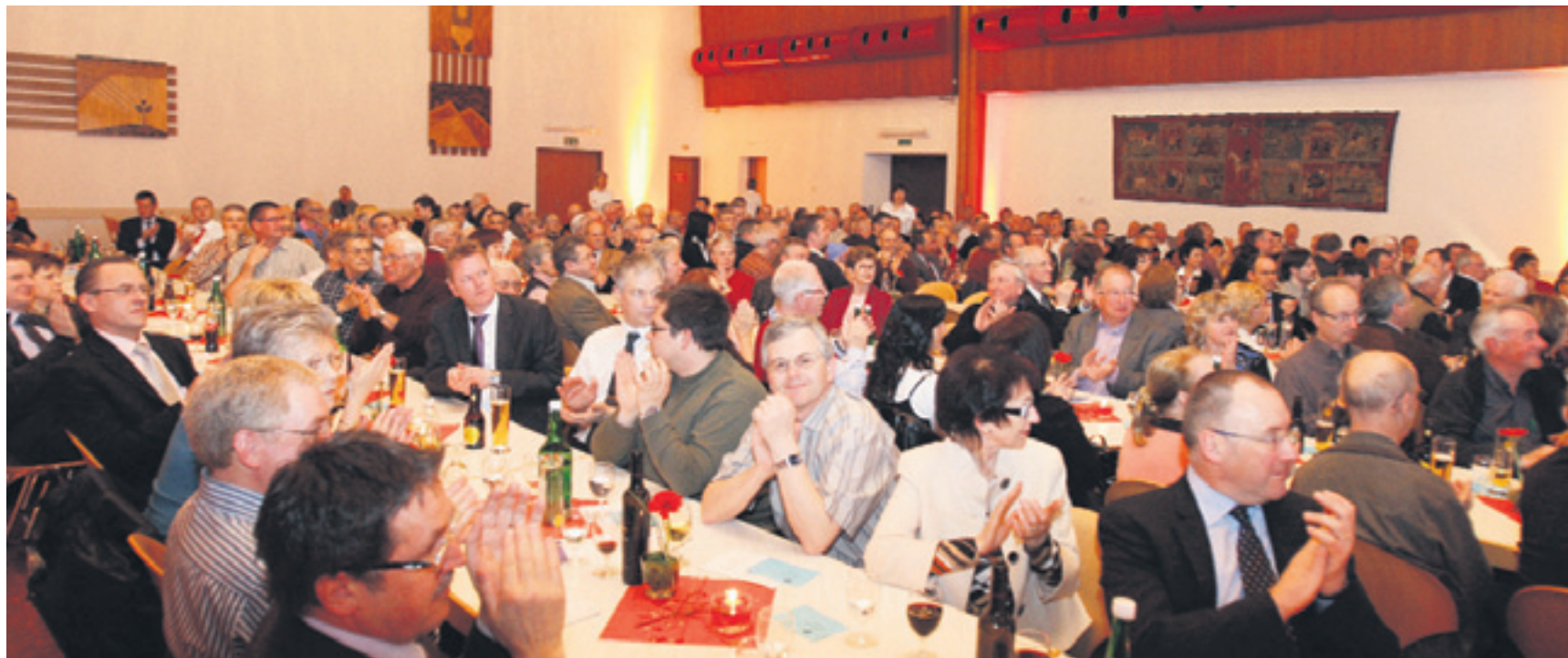
Grosses Interesse: 280 VU-Parteifreunde wollen sich die Ausführungen des designierten Regierungschefs zur Zukunft der Liechtensteiner Politik nicht entgehen lassen.

Dieser Parteitag war sehr sachlich. Die Grosse Koalition begrüsse ich, weil sie zurzeit sicher das Beste für unser Land ist. Im Koalitionsvertrag gefällt mir sehr gut, dass es einen Koalitionsausschuss gibt, der Probleme löst. Das gibt mir ein gutes Gefühl für eine bessere Zusammenarbeit der Grossparteien.